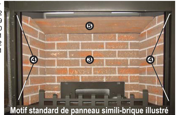
Motif standard de panneau simili-brique illustré

Originellement, la couleur des panneaux de brique varie à différentes teintes de brun. Pendant les premières utilisations, les panneaux s'assombriront temporairement et dégageront une légère odeur pendant quelques heures. C'est un phénomène normal qui ne se reproduira plus. Ouvrez simplement une fenêtre pour aérer suffisamment la pièce. La couleur des panneaux s'éclaircira de façon permanente à l'usage.