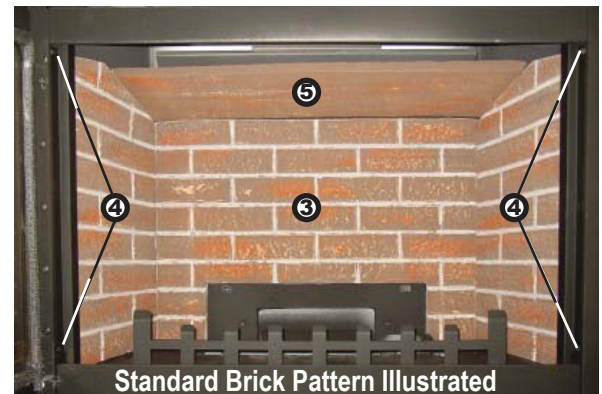
Standard Brick Pattern Illustrated

When shipped, the brick panels range in varying shades of brown. During initial use, the panels will darken temporarily and emit a slight odour for a few hours. This is a normal condition that will not occur again. Simply open a window to sufficiently ventilate the room. The appearance of the panels will permanently lighten in colour with use.